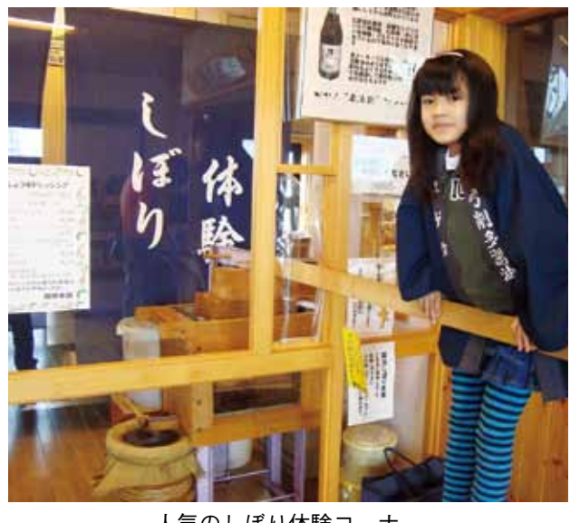
人気のしぼり体験コーナー

きょう、あすの2日間開催される醤油遊王国祭は両日も午前9時から午後5時まで。工場見学や日高市の当地グルメ「高麗鍋」高麗鍋の素、新商品の「醤油ラスク」や「にんにく醤油」の販売、クジ引き、プレゼントなどを行う。 醤油王国の住所は日高市田波目804-1。問い合わせは985・8011。