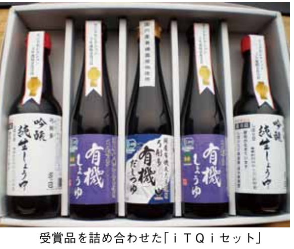
受賞品を詰め合わせた「iTQiセット」

同社の看板商品となる「有機しょうゆ」吟醸純生しょうゆが、iTQi国際優秀味覚賞を受賞した。iTQiとは「International Taste & Quality Institute」(3250円)。歳暮やギフトにも最適だ。 また、有機しょうゆ、吟醸純生しょうゆについては、ベルギー政府主導の民間団体が行う食品業界のオリンピック「モンドセレクション」で3年連続金賞を獲得し、国際優秀品質賞を受賞している。 今回の受賞を記念し、有機しょうゆ300ミリリットル2本、有機だししょうゆ300ミリリットル1本を詰め合わせた「iTQiセット」(3250円)。歳暮やギフトにも最適だ。