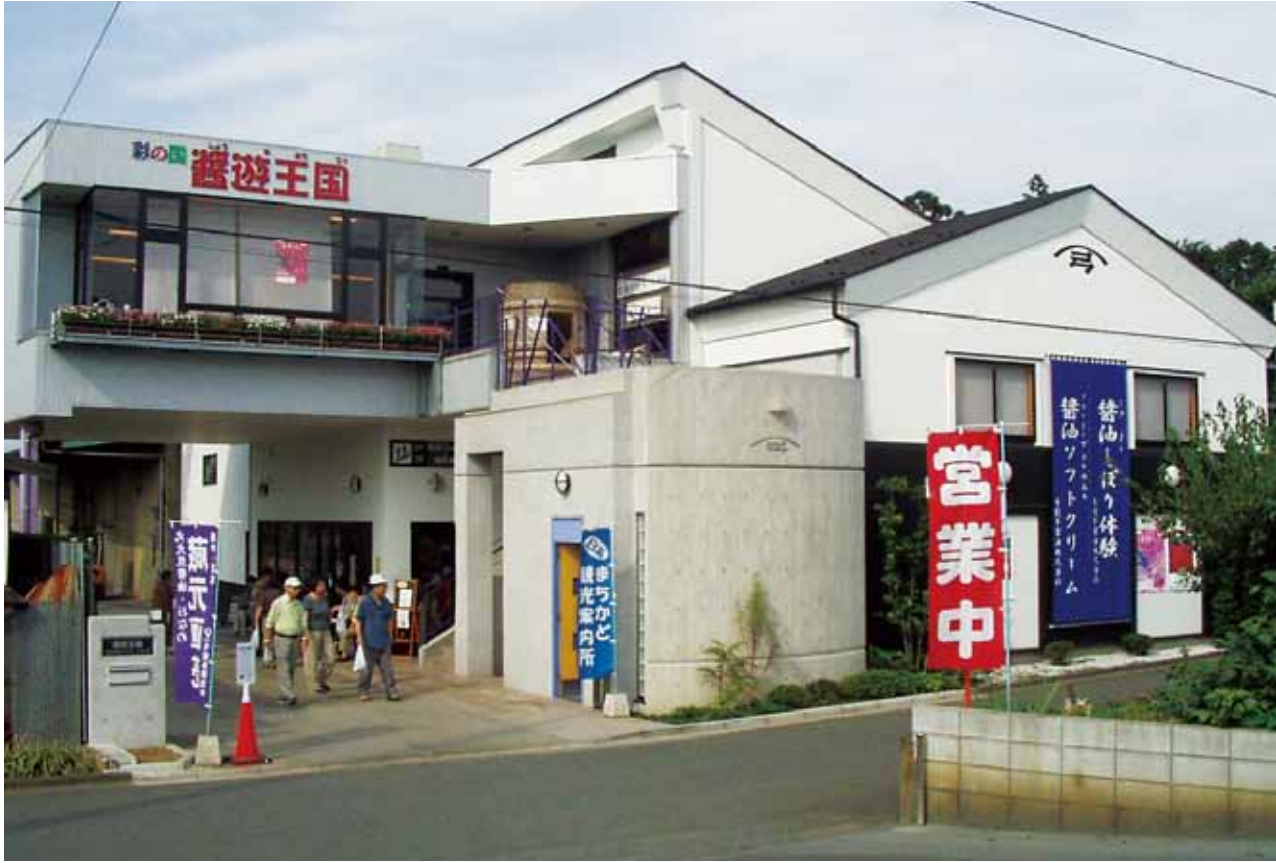
楽しみながら醤油について学べる「醤油王国」